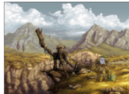
Vertonung Spiele-Sound aus Hamburg